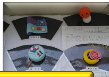
しかけ絵本(3年)・和菓子デザイン(2年)