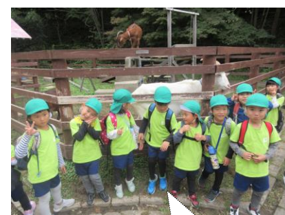
ヤギと一緒にポーズ