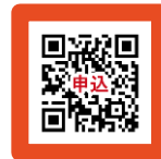
▲申し込みフォーム