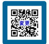
▲キャンセル・変更フォーム

★Webフォームをご利用の場合、 入力内容が自動返信 されます。受信可能な設定への変更、メールアドレス等の正確な入力をお願いいたします。 ☆受付でスマートフォン等やFAX送信票の控えをご提示いただく場合がありますので、 自動返信画面や送信票の保存、保管 をお願いいたします。