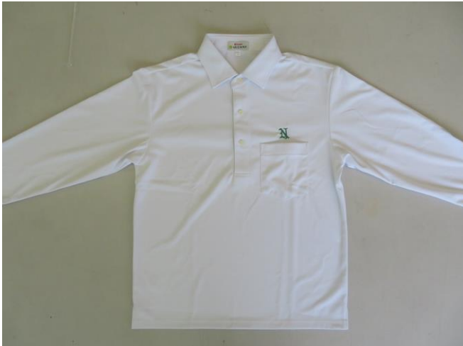
ポロシャツ 新型(Bタイプ) ※名前刺繍はありません

尚、購入に関してはスクールガイドブック P12 に記載しておりますので、ご確認ください。