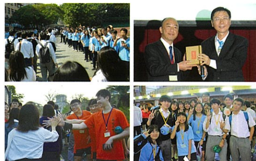
台湾・南投高級中學（高校）との交流