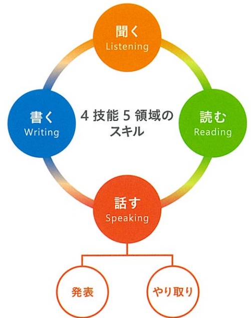
英語力を総合的に伸ばすシステム