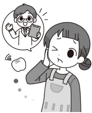
き ちりょう 気になるころの治療