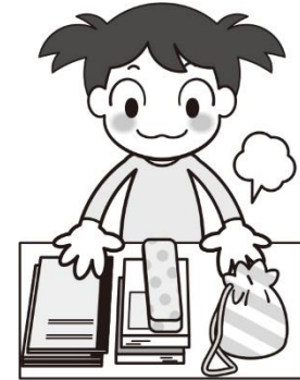
しんねんど ひつよう もの じゅんび 新年度に必要な物を準備