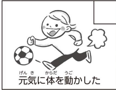
げんき からだ うご 元気に体を動かした