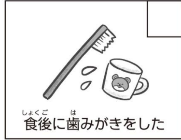
しょくご は 食後に歯みがきをした