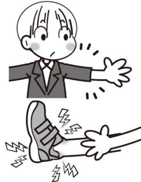
びく くつ かくにん 服や靴のサイズの確認