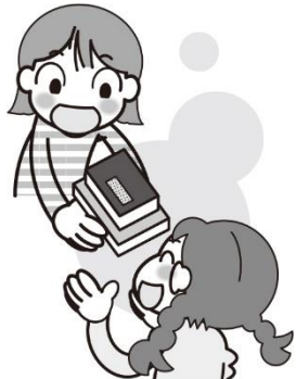
か かせ 借りたものを返す