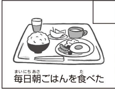
まいにちあさ た 毎日朝ごはんを食べた