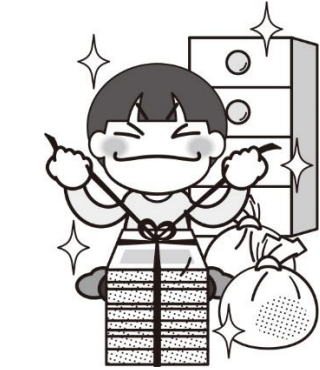
み まわ せいり せい 身の回りの整理・整頓