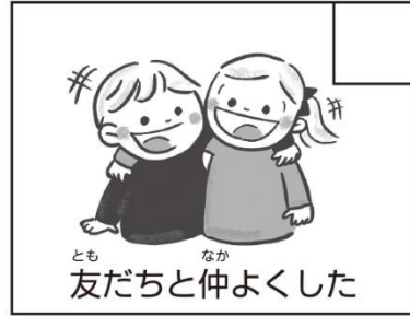
とも なか 友だちと仲よくした