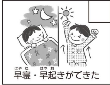
はやね はやお 早寝・早起きができた