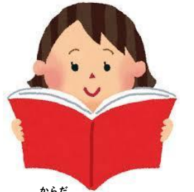
体について知りたいとき