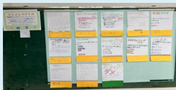
としょしつクイズにチャレンジ