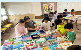
どれも面白そうだなあ～

みなさんも夏休み前に図書室に来て「自分の心がワクワクする本」を見つけてみませんか?本の中には、みなさんの可能性を広げてくれる冒険や、新しい発見がたくさん詰まっています。それが、みなさんの夢をかなえるための第一歩になるかもしれませんよ!