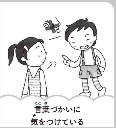
言葉づかいに気を付けている