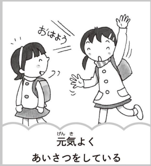
元気よくあいさつをしている