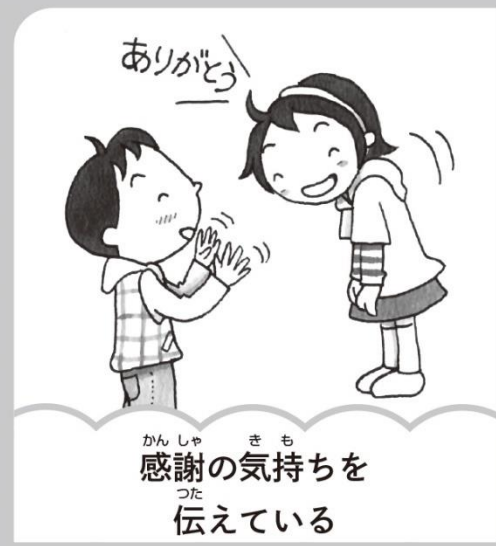
感謝の気持ちを伝えている