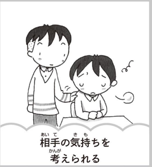
相手の気持ちを考えられる