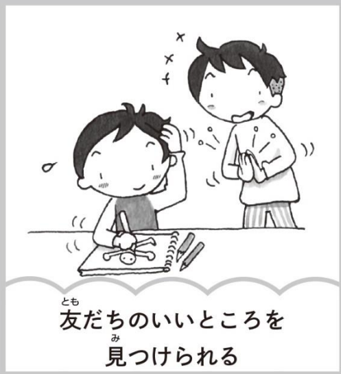
友だちのいいところを見つけられる