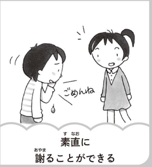
素直に謝ることができる