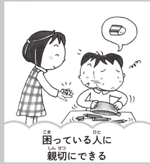
困っている人に親切にできる