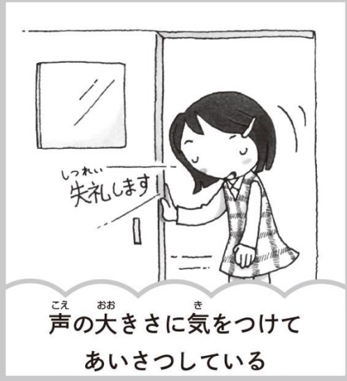
声の大きさに気を付けてあいさつしている