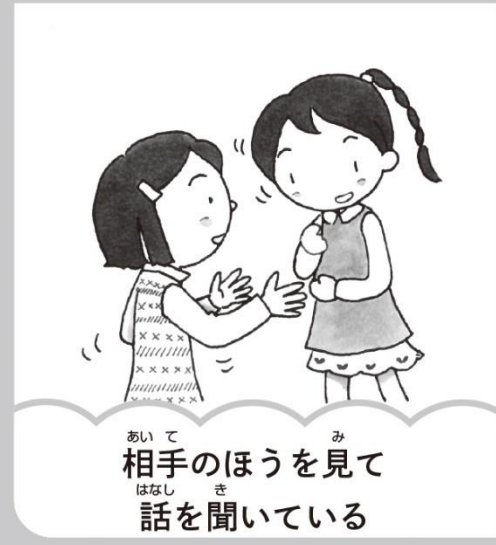
相手のほうを見て話を聞いている