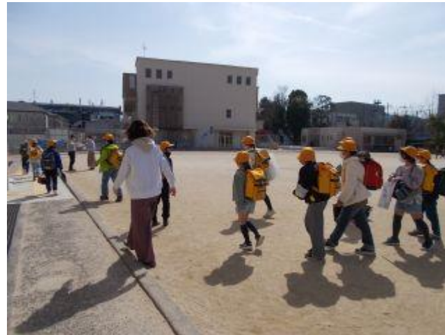
新しい登校班で下校です。 6年生が後ろから見守りました。