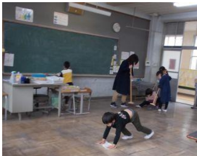
1年生もとても上手にそうじができます。