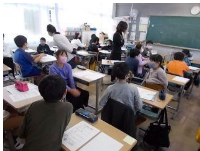
困った時の対処方法をグループで交流しました。