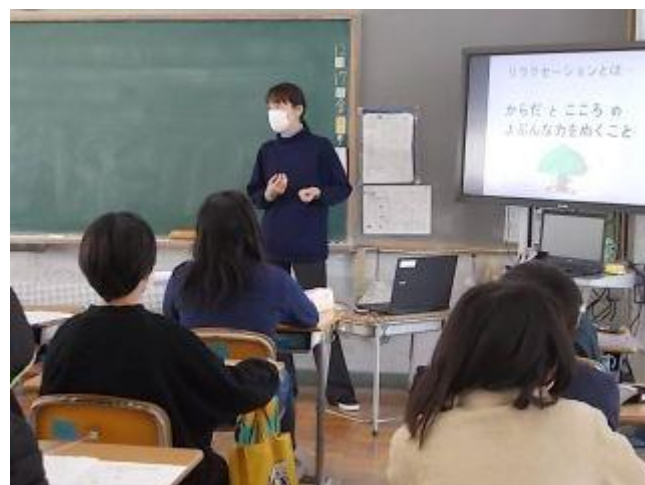
セルフ・リラクゼーションを体験しました。

5年生は保健科の時間に不安や悩みの対処法について、スクールカウンセラーさんから学びました。 題して「心の学習」です。 不安や悩みはどうしておきるのか？そして、その時の対処の方法を実践を交えて教えていただきました。