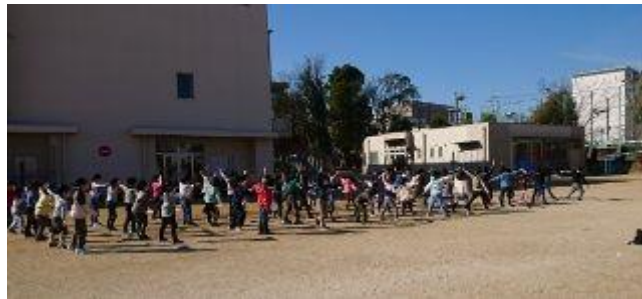
1年生 「少年少女ぼうけんたい」のダンス

2月25日(木)6年生を送る会のリハーサルを行いました。 空気は澄んだ冷たい日でしたが、青空の下で心ひとつにして練習をしました。