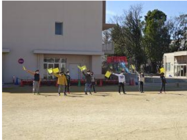
4年生 児童創作出し物

雨で延期になっていた6年生を送る会。明日は晴天の下行う予定です。 6年生への感謝の気持ちをいっぱい添えた、心温まる送る会になることでしょう。