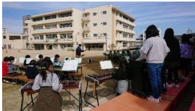
5年生・6年生は合奏を披露します。