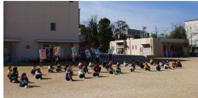
2年生 「にじ」を手話で表現