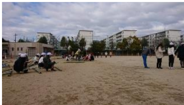
3年生 竹を使ったダンス