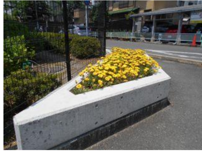
これは「ガザニア」という花です。 体育館東側一面に咲いているのは一見の価値あります。