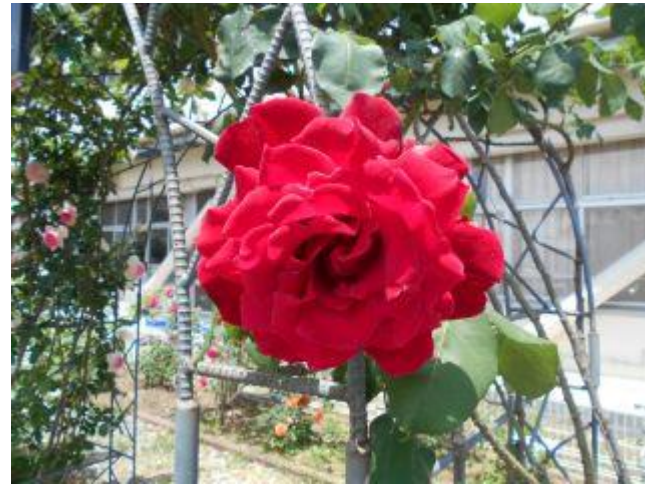
これはバラ園の「バラ」。堂々たるものです。 いろいろな色のバラが咲いています！学校東側道路から見れますよ。