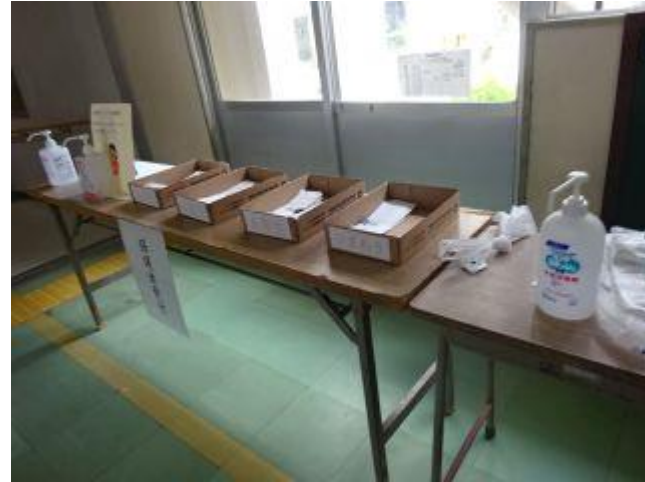
受付にて保護者の健康チェックに協力いただきました。 ありがとうございました。