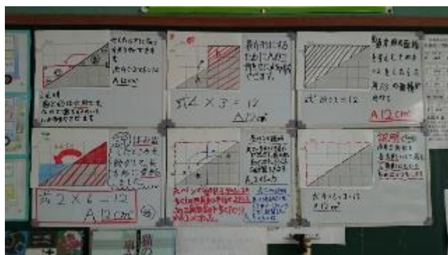
学びの足あと(5年生)