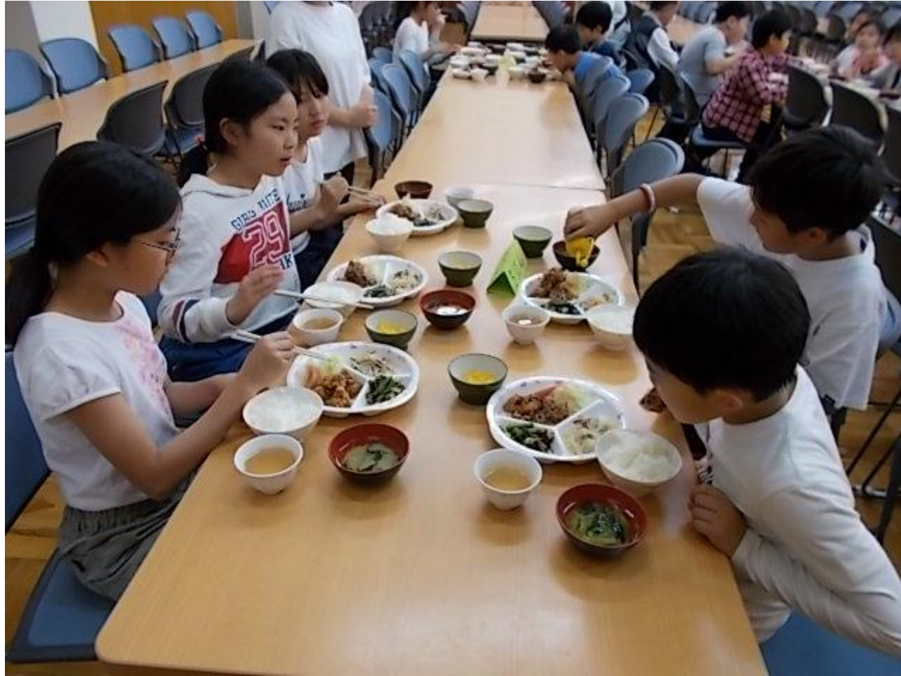
キャンプファイヤー・・・「火の神」がやってきた！