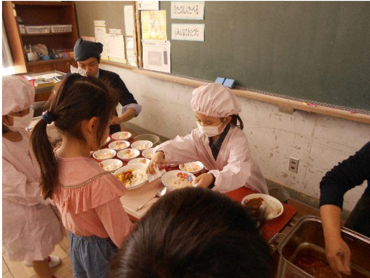
給食当番は仕事を一生懸命覚えています！ 「やろう！」という気持ちが前面に出ていました！