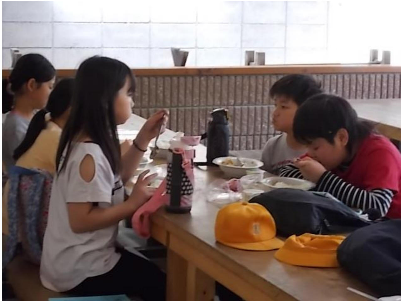
↑ そして、カレーをおいしくいただきました。「いただきま〜す！」 みんな頑張ったので予定の時間より早くできあがりました！