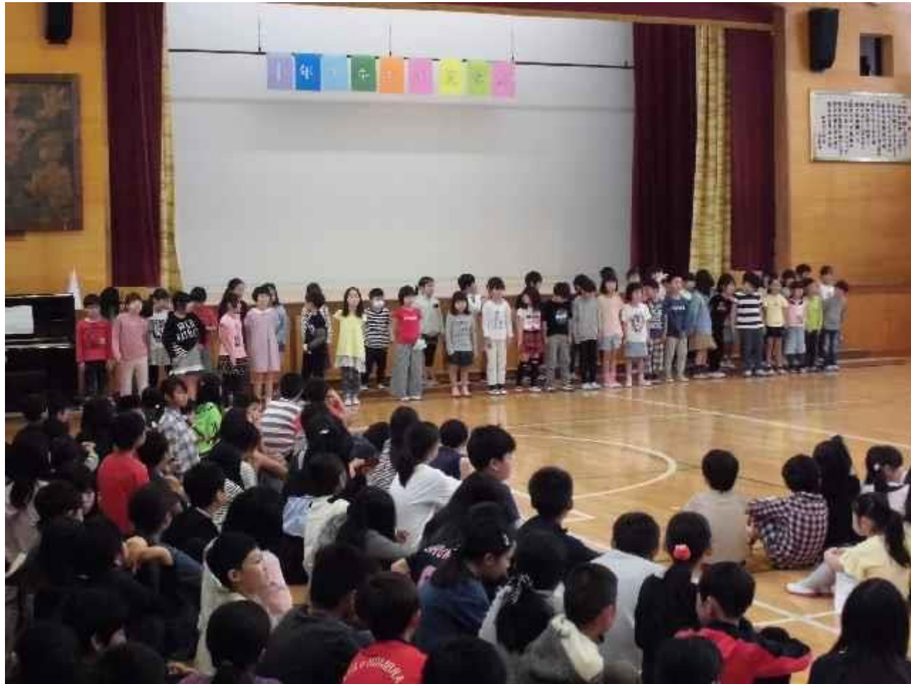
3番は「3年生」のリコーダー演奏 4番は「4年生」の劇とリコーダー演奏