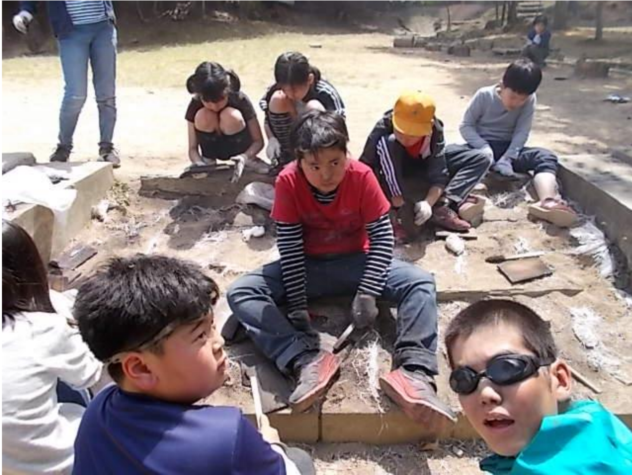
↑ 火を起こして 熱っ！