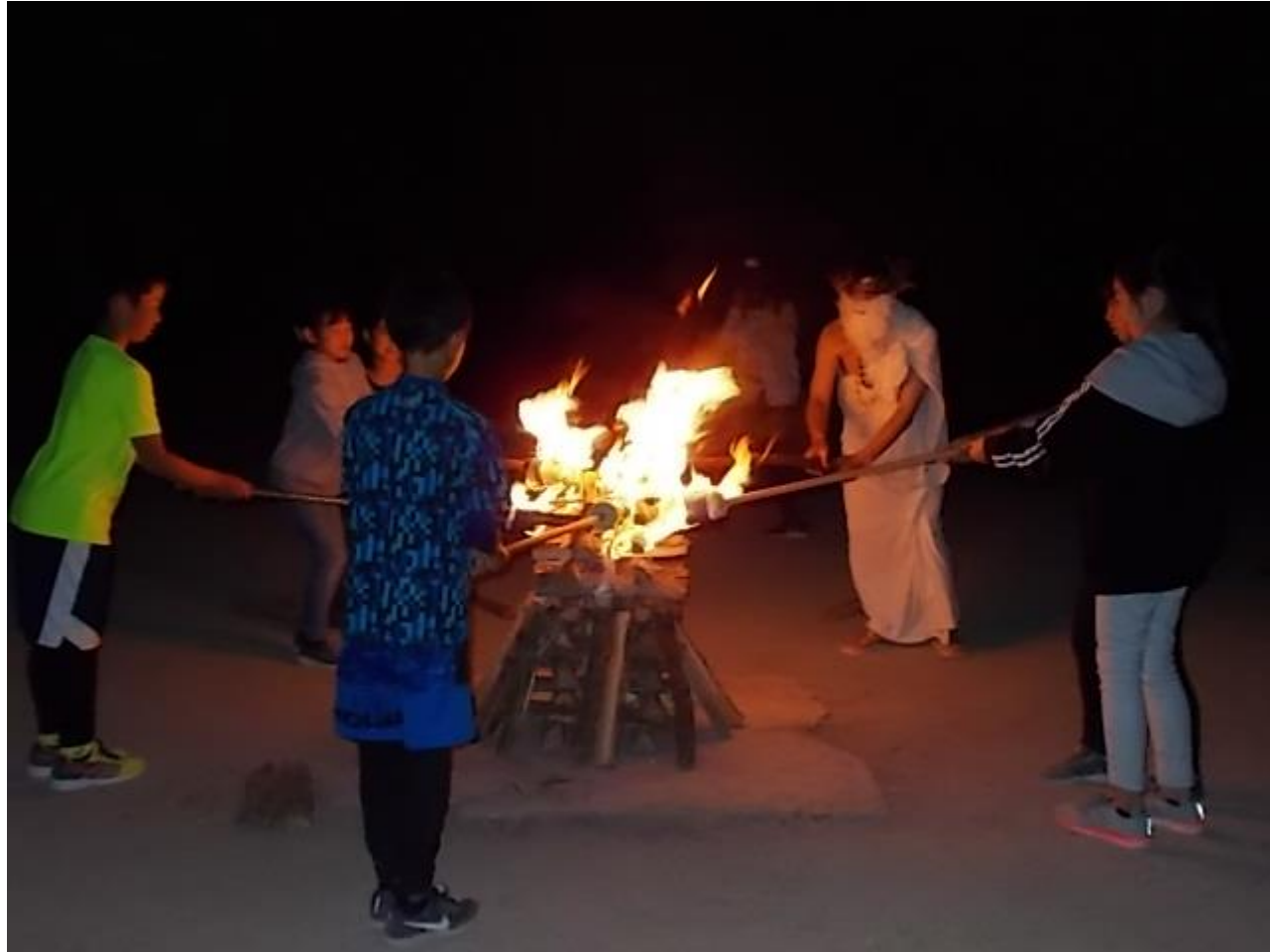
歩き疲れたのに、フォークダンスで DANCING !