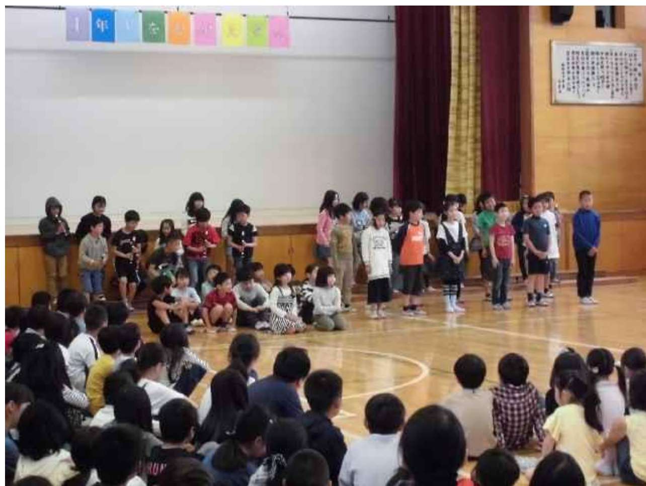
5 番は「5 年生」の先生紹介