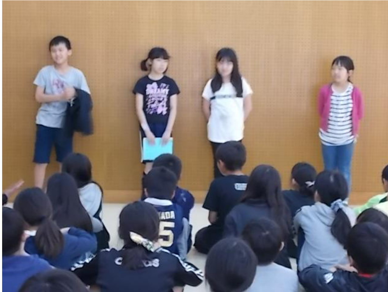
↑ 退所式 所長さんにお礼をいいました。「お世話になりました！」