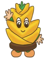
すくすくタケちゃん

長岡京市下海印寺東山1番地 TEL.952-0005 FAX.951-5391 HP アドレス https://www.kyoto-be.ne.jp/nagaoka5-es/cms/