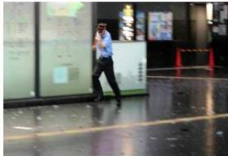
落下してきたガラスなどの落下物から逃げる駅員 (4日午後2時27分、京都市下京区・JR京都駅)