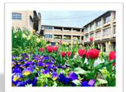
4月6日の築山の様子

では皆さんにとって、「笑顔輝く長四中LIFE」がさらに充実するように、新しい年度を楽しく有意義に過ごしていけることを願い、私の式辞とします。