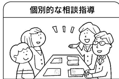
個別的な相談指導

学校給食は、生徒が健康な状態を維持し、体位の向上を図り、望ましい食習慣と食に関する実践力を身につけるために、重要な教材となります。また、地域の文化や伝統に対する理解と関心を深めます。