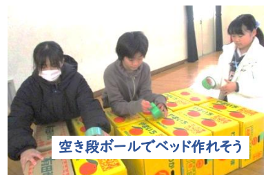
空き段ボールでベッド作れそう