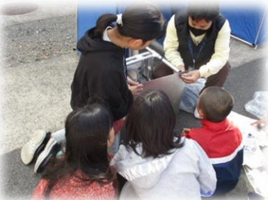
教師も子どもも防災訓練に参加

すくすくキッズテンと1年とのコラボが実現し、2つの新しい取組を実施しました。1つは、すくすく教室の模擬体験として、竹ドミノ・ダーツ・バレエを、もう1つの昔のあそび体験では独楽・竹返し・おはじきを指導員の方から教わりました。すくすく教室への興味が高まり、多くの子どもが参加するようになり、指導員の方々にとっても長十小の子どもを知っていただく機会となりました。