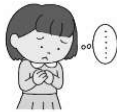
はなしやそうだんを したいとき