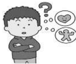
からだやこころについて しりたいとき