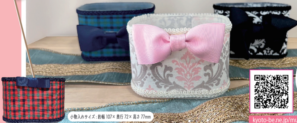
小物入れサイズ: 約幅107×奥行72×高さ77mm