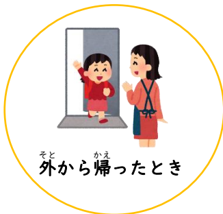
外から帰ったとき