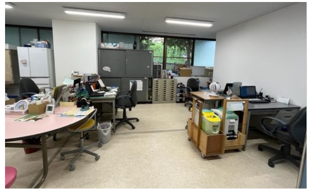
保健室の先生(養護教諭)と、看護師さんの机です。