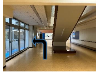
2階へ上がる階段の左側に保健室があります。