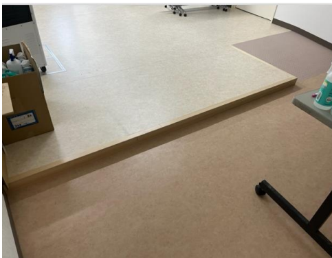
少し高くなっていますが、靴のまま入ります。スロープも付いています。