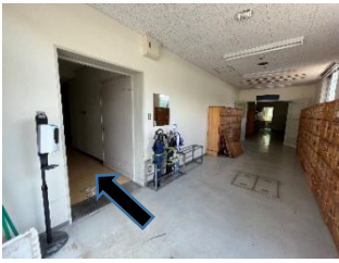
スクールバスが駐まる入り口から入ってまっすぐ進みます。