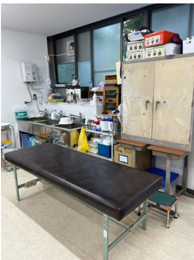
怪我をしたときなどに手当をするところです。