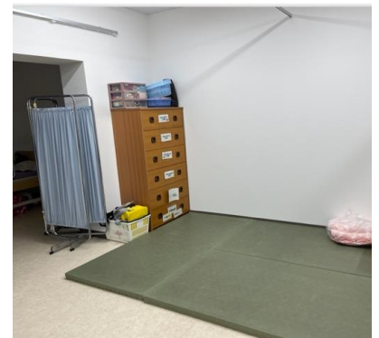
身体測定や、着替えをするスペースです。

児童生徒の皆さんが安心して使える保健室になるように、工夫してまいります。何かあれば、保健室までお知らせください。