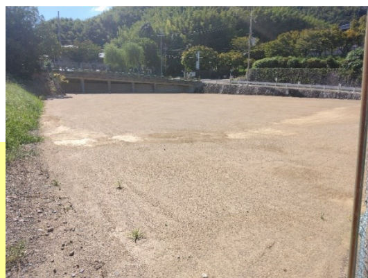
谷山池グラウンドの様子