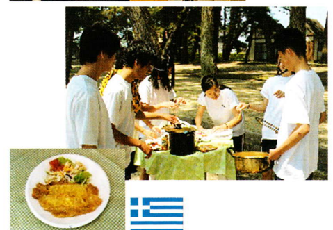
滋賀県立大学講義 & 世界の料理コンテスト 等