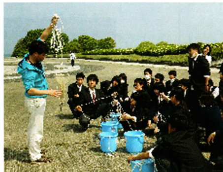
同志社・龍谷大学講義 & 琵琶湖博物館実習 等