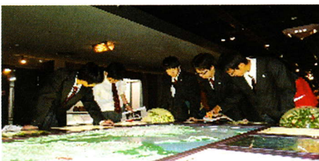
人と自然の博物館実習