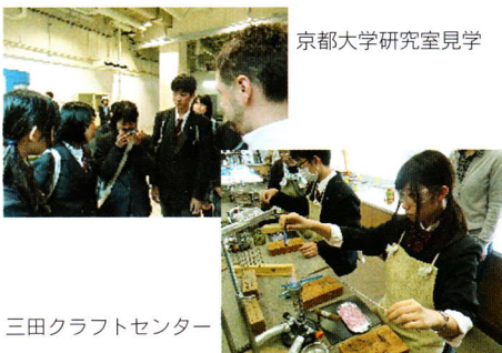
京都大学研究室見学