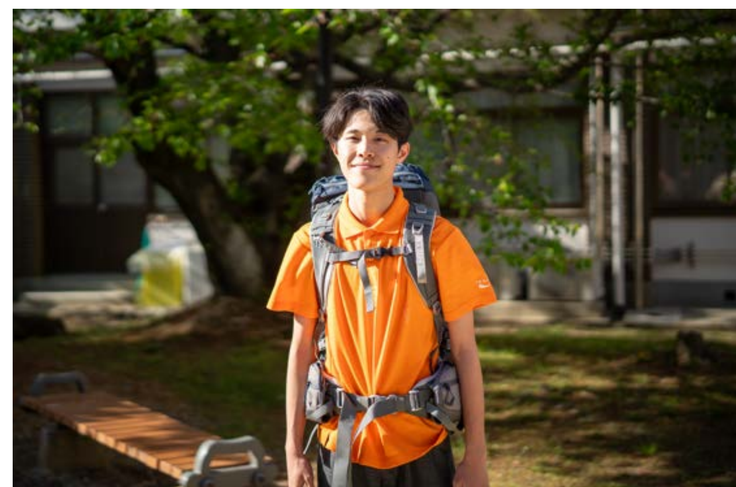
桐村くんの1日のスケジュール