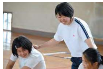
小学生とのスポーツ交流