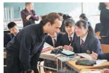
アベリスツイス学生との交流