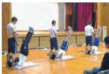
トレーニングプログラムの発表