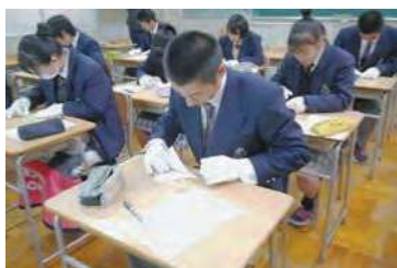
オリンピック・パラリンピック事業