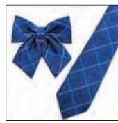
ネクタイ & リボン