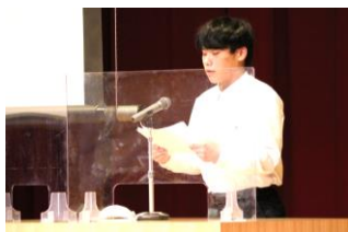
生活体験発表大会

自分たちが作った服を着て全体の前で歩き、ポーズをとる姿は、光と音響の効果も加わり、記憶に残るシーンの連続でした。展示は、全校生徒で取り組んだ「Joyfull Sea World」が目を引きました。ジンベエザメ等の海の生物をステンドグラス風に製作したもので、つるすことのできるような雰囲気をつくりました。この他にも農業科のハイドロカルチャー、各学科の課題研究、国語科の俳句等が並びました。販売では、農業科のみずみずしい野菜、家政科のパンやプリン等が並び、求める列に笑顔がありました。