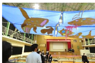
Joyfull Sea World