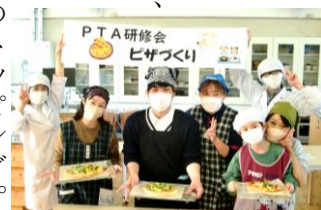
焼きあがったピザと記念撮影

十二月十日(土)、家政科と保健体育科の先生に協力いただき、三家庭五名が参加しました。ピザ生地をこねる作業から始まり、生地の発酵を待っている間に別会場でシェイプアップ運動を音楽に合わせて行いました。その後、ピザのトッピング。ここでは家政科が開発した、こだわりの「トマトソース」を使用しました。焼きあがりには上々。食欲をそそるピザの匂いで会場は包まれました。