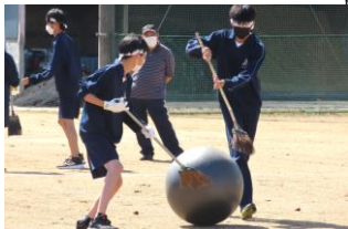
魔女の大玉ころがし

も増して熱心に応援する姿があり、生徒一人ひとりが競技に精一杯頑張る様子が見られました。また、昨年と同様に多くの保護者や家族の参観がありました。保護者の方には、「パン釣り競争」に参加していただきました。釣り竿でパンを釣る種目ですが、なかなか針の部分がかかからなくて四苦八苦する姿があり、周囲で見ていた生徒が助けに行くシーンがありました。見ている者も競技をしている者も一緒になって競技を楽しむ雰囲気一杯でした。