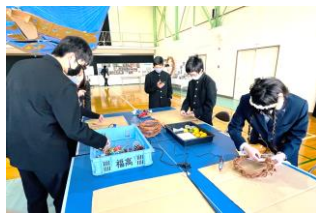
リース作りの様子

十一月十二日(土)の文化祭では、初の取組としてリース作り体験を行いました。リースの材料にはブドウの剪定枝を使用し、生徒が丸く形を整えリースにして準備しました。当日は来場した保護者や家族、そして生徒がとても楽しんで体験していました。完成したリースは大型のリースにつながり、福知山市民憲章推進大会会場に展示していただきました。