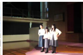
ファッションショー