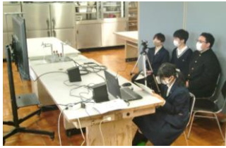
田舎力甲子園(リモート)

また、校内では新型コロナウイルス感染症拡大の防止を図りながら、野菜苗、花苗の販売会、タマネギ苗の販売にも取り組むことができました。さらに、