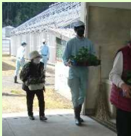
苗運びを手伝う様子

農業科の生徒が、訪れる人の質問に丁寧に受け答えをしたり、苗を入れた箱をレジヤ車まで運んだり、誠実に対応する姿が印象的でした。