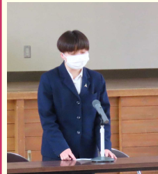
あいさつする生徒会長

ここ2年間は放送による総会でしたが、本年度は体育館に集まり、全校そろっての行事となりました。