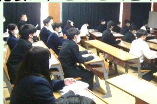
熱心に聞き入る生徒の様子

この新しい「トライ」を通して、 発見する楽しさ、人と一緒に学ぶ楽しさ を感じてほしいと思います。