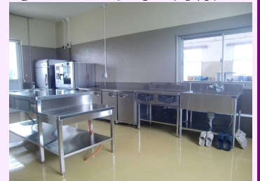
通称名が「MVP」に決まった食品加工室

この部屋でつくられる様々な加工品が、 食を通じて人々に幸せな時間を届けられるよう 取り組んでいきます。