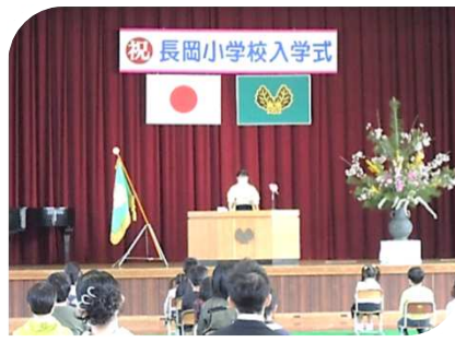
長岡小学校：入学式 9名 の新入生が入学しました。