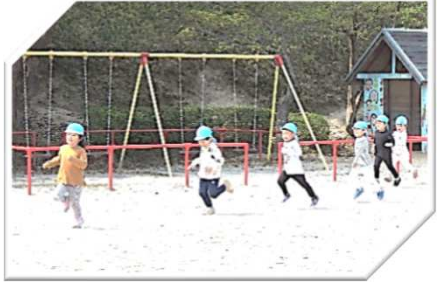
ゆうかり子ども園：朝の体力作り