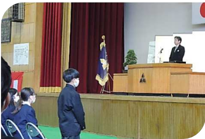
峰山中学校：入学式 94名の 新入生が入学しました。