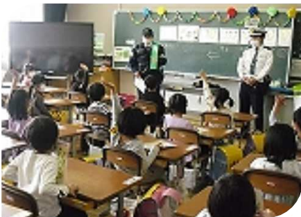
しんざん小学校1年生：京丹後 警察による防犯と交通安全の話