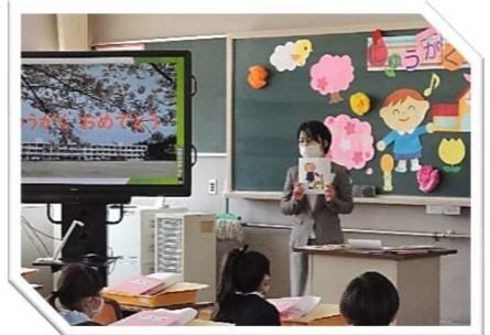
いさなご小学校1年生：入学式 後の教室での様子