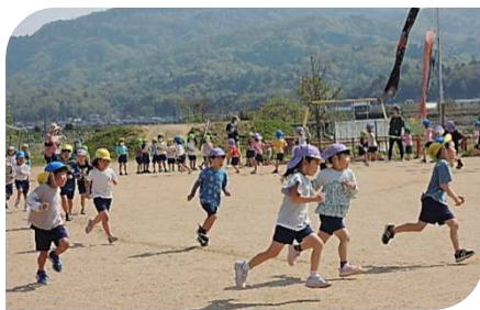
峰山こども園：朝の体力作り

こども園では「小学校入学までに目指す10の姿」を目指して様々な活動を取り入れています。朝の体力作りもそのうちの1つです。遊びや活動を通して子ども達に様々な力を育てていきます。