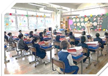
峰山小学校1年生：入学式後の 教室での様子