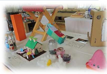
長岡小学校: 夏休み作品展 低学年は工作を中心に、高学年は自由研究を中心に取り組みました。