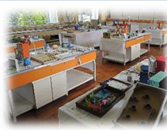
いさなご小学校: 夏休み作品展 工作に絵画、高学年は自由研究にも挑戦。様々な作品が並びました。