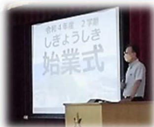
峰山小学校: 始業式 1学期に伸ばした力をさらに伸ばしていく2学期に。

猛暑の夏休みが終わり、峰山学園の各小中学校の2学期が始まりました。8月29日(月)に小中学校では始業式が行われ、子ども達は楽しかった夏休みの思い出を胸に元気に登校してきました。市内の感染状況はまだまだ予断を許さない状況があり、再度、感染予防に向けた留意点を確認し学校生活をスタートさせています。たくさんの行事が予定されている2学期ですが、子ども達にとって実り多い2学期になるよう、学園が目指す姿に向かって園小中学校が更なる歩みを進めていきます。2学期も引き続き、ご支援をよろしくお願い致します。