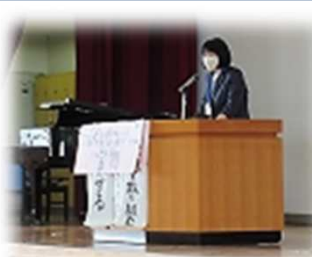
しんざん小学校: 始業式 弱みを強みに変えて苦手なことにも挑戦していく2学期に。