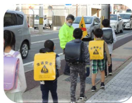
安全ボランティアによる見守り活動：「おはよう。」の温かい声掛けとまなざしで子ども達も元気をチャージ。安心して登校できます。