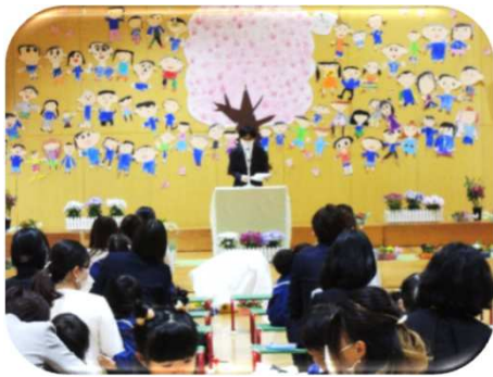
峰山こども園入園式