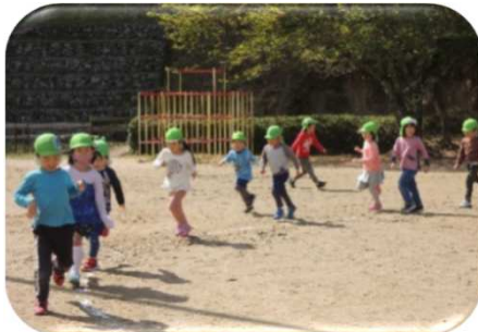
ゆうかり子ども園：朝の体力作りで園庭を走る子ども達