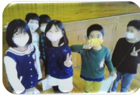
いさなご小学校：2年生が1年生をリードしての学校探検