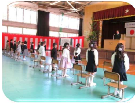
峰山小学校入学式