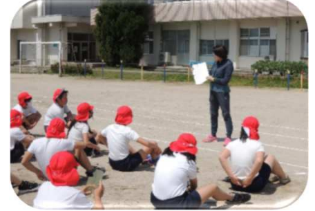
しんざん小学校：中学校教員が5・6年の体育をT・Tで指導