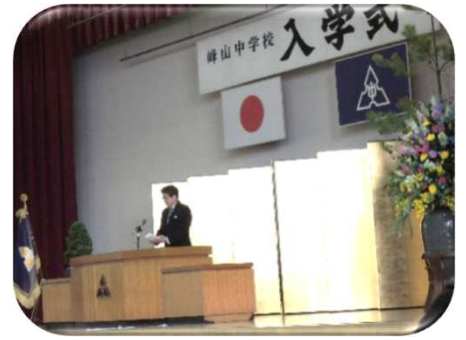
峰山中学校入学式