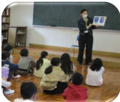
長岡小学校：読み聞かせボランティアによる読み聞かせ