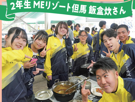
2年生 MEリゾート但馬 飯盒炊さん