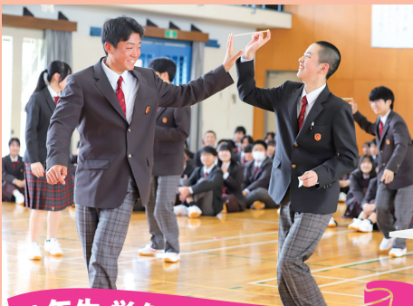
1年生 学年レクリエーション