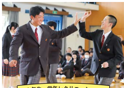
1年生 学年レクリエーション