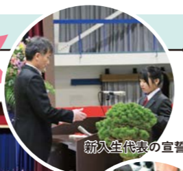
新入生代表の宣誓