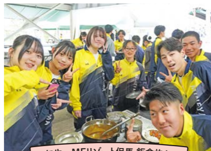
2年生 MEIリゾート但馬 飯盒炊さん