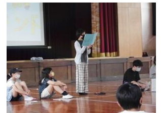
▲集会でグループの活動をお知らせする児童