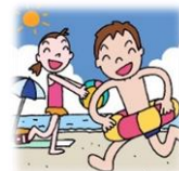
あおぞら学級「国語」