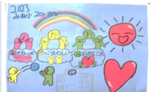
▲児童会作成のスローガン