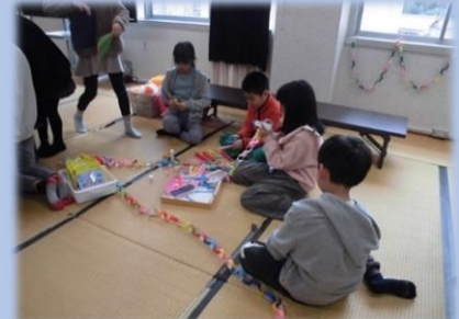
▲5年生の呼びかけで集まったかざりつけグループ