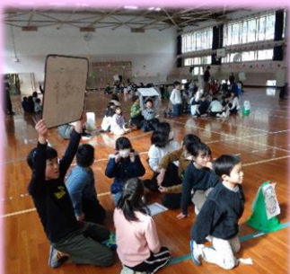
▲掃除グループで取り組むクイズビンゴ大会