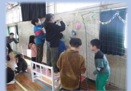
▲前日に協力して会場の飾りつけをする子ども達