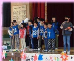
▲全校遊び「石木鬼」の鬼たち