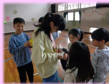
▲プレゼントのメッセージを読む6年生