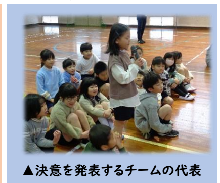
▲決意を発表するチームの代表

「8の字会」は10人以上でチームを作り、大縄で8の字跳びをします。今回は3チームがエントリーし、休み時間を使って練習をしました。