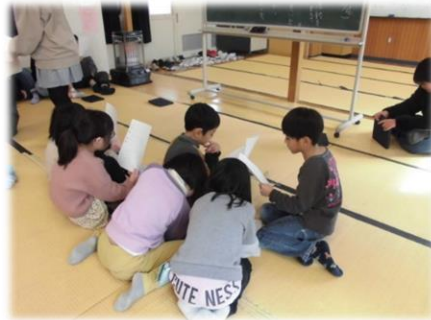
▲学級で話し合う内容を確認する1・2年生