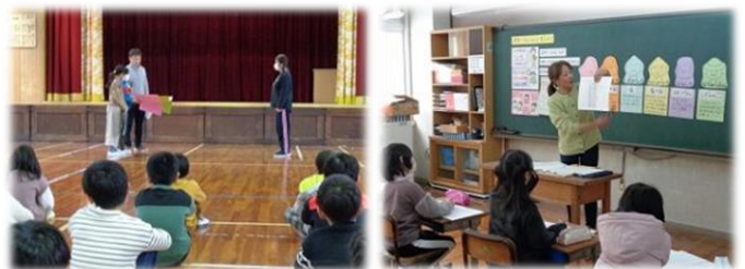
▲調理員さんへの感謝の手紙

また、峰山中学校の栄養教諭の先生に来ていただき、食に関する学習を進めました。心身の成長や健康のために望ましい食事やおやつのとりを学びました。