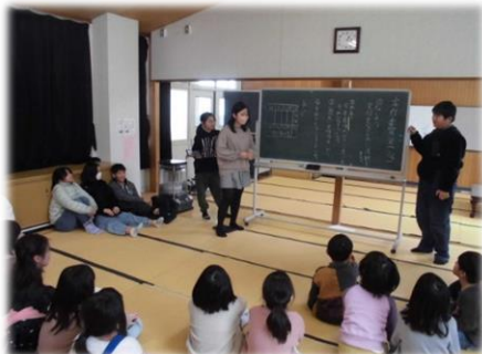
▲第1回実行委員会を進める5年生

全校のみんなでつくりあげる最後の取組が始まっています。まずは5年生が「最後の思い出活動」において話し合いました。それぞれの意見にはメリットやデメリットがあり、なかなか意見がまとまりませんでした。それでも、5年生は多数決という手段は選ばず、みんなの納得をつくることを大切に、話し合いを進めました。最終的にそれぞれの意見の良さを取り入れた案を作り出しました。そして、全校の願いを実現したいという思いを持ち、各学級から実行委員を募り、実行委員会を立ち上げることになりました。