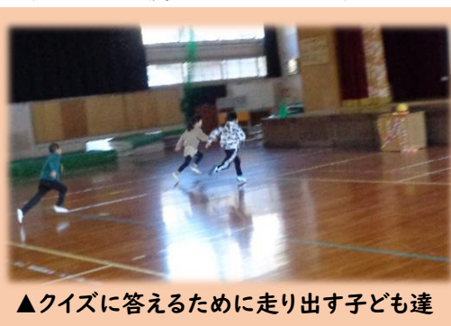
▲クイズに答えるために走り出す子ども達