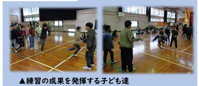
▲練習の成果を発揮する子ども達

当日は全校が見守る中、練習の成果を発揮することができました。がんばった3チームには大きな拍手が送られました。