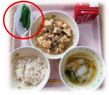
スナップえんどうのしおゆで