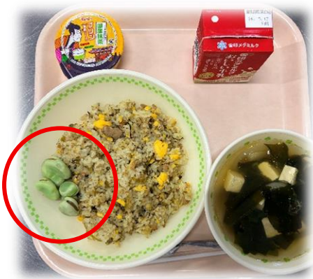
そらまめのしおゆで