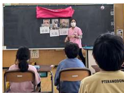
低学年:歯のクイズ