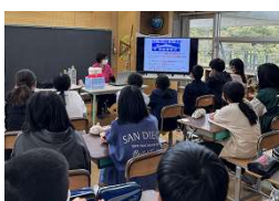
高学年:歯周病の成り立ち