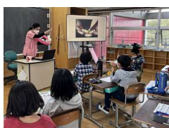
中学年:でこぼこ歯の磨き方