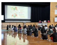
歯科衛生士さんの講話