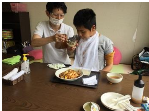
昼食中。ペロリと完食です。