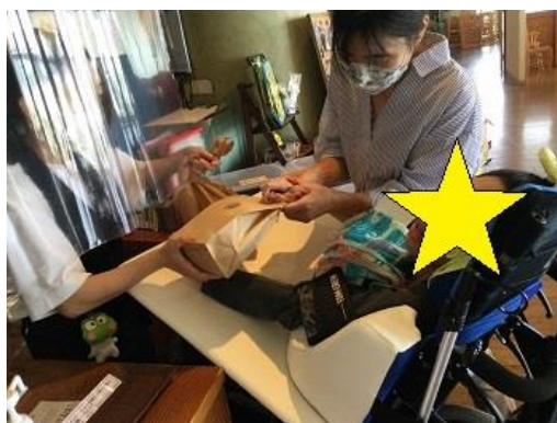
お土産も計画的に買っています。