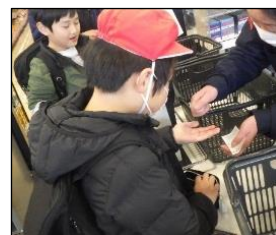
レジでの支払いもばっちり。