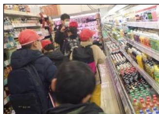
「買わない商品は、触らない」だね。

4組では、「約束を守って、商品を購入すること」「学外で友達や先生と一緒に行動すること」などをねらいに、買い物学習に取り組みました。事前学習では「歩いて移動する」、「買わない商品は触らない」等のスーパーでの約束についてスライドを見ながら学び、購入する商品を探したり支払いの仕方を練習したりしました。当日は、メモを頼りに目当ての商品を探し、レジで財布からお金を出して店員さんに渡すなど、約束を守って上手に購入できました。後日、買ってきた商品を使って調理実習で「ピザ作り」をしました。