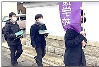
地図を見て自分たちでルートを考えて回りました。