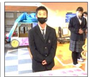
こちらで受付をお願いします。