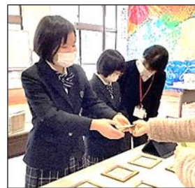
自信をもって接客

4組では「刺繍アート」を制作しました。自分たちでオリジナルのキャラクターを描いたり、選んだりして布に刺繍をしました。線の上を細かく均等に縫えるよう、集中して取り組むことができました。当日は、たくさんのお客さんに来ていただき、練習してきた接客の成果を発揮することができました。