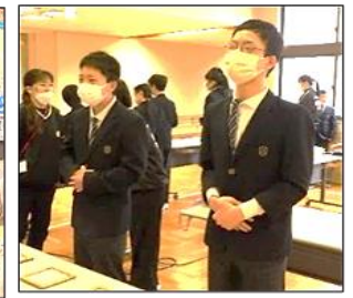
販売姿勢もキリッと☆