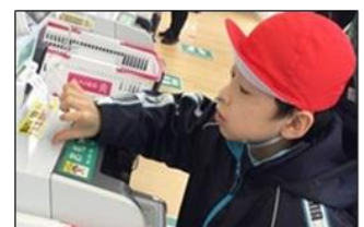
セルフレジでのお会計にも挑戦しました。

10組では、「学級集団でマナーを守って活動することができる」をねらいに、ダイソー西舞鶴モール店で買い物学習を行いました。ダイソーでは、にこにこランチチャレンジで使用する「できましたシール」と保護者から頼まれたお遣い商品を購入しました。シール選びでは、100種類近くある中から自分の気に入った商品を手に取り「これにする！」と選ぶことができました。保護者からのお遣いでは「おつかいメモ」を見ながら商品を探して、頼まれた商品を見つけて購入することができました。学校につくと「お遣いできた！」や「また行きたい！」などの達成感あふれる声を聞くことができました。今後も、公共施設でルールやマナーを守ることのできるよう学習に取り組んでいきます。