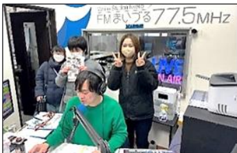
FM舞鶴で宣伝していただきました。

チラシを配付していると、「モスバーガーの作品展示を見たよ。」「バスにも大きくポスターが貼ってあるね。」などと、たくさんの方から声を掛けていただき、地域の方々に本校の取組を知っていただいていることを実感しました。総移動距離が10kmを超える班もありましたが、生徒たちは充実の表情でした。