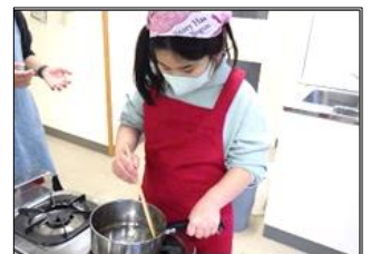
ジュースを煮て寒天を溶かしています。

工程の中で、一人で挑戦したり、指導者と一緒に取り組んだり様々ですが、ジュースやフルーツを選んだり、彩りを工夫したりと一人一人の思いの詰まったゼリーを作ることができました。今後も、子ども達の「できた！」を大切にしながら「やってみよう！」につなげられるよう学習していきます。