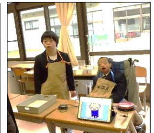
「いらっしゃいませ。」