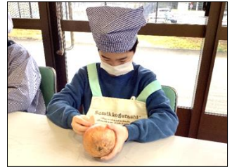
みんなでむいた玉ねぎは、翌日の「酢豚」に使われました！

1月24日(水)から給食で実施された『世界のグルメ給食』献立を振り返り、5か国の料理の写真を見て、どんな料理があるのかを学びました。給食の献立を思い出して「インドはカレーでしょ！」や「韓国のトゥンワッフルおいしかった。」と子ども達から声が上がっていました。また、給食がどのように作られているのか、調理室の仕事の様子を写真や映像で見て学んだ後、実際に次の日の給食に入る玉ねぎの皮むきに取り組みました。自分達が食べる給食の一部だという意識が高まり、食材を丁寧に扱い、綺麗に皮をむいて調理員さんに渡すことができました。