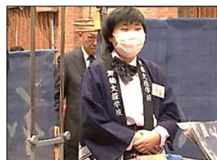
素敵な立ち姿です!