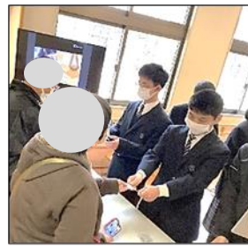
「ありがとうございました！」

1学期に生活単元学習で学習したSDGsの取組を生かして「マイ・リサイクル・キーホルダー」を作りました。ペットボトルキャップを集め、洗浄・色分け・切る・フレームに入れてアイロンで固める・紐付け・袋詰めと、全ての工程を自分たちで行いました。接客練習では、販売だけでなく呼び込みの練習も行い、本番はたくさんのお客さんに購入していただくことができました。舞ショップ終了後に、みんなでチケットの枚数を数えて喜びを分かち合いました。