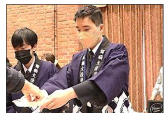
「レシートとお釣りでございます!」