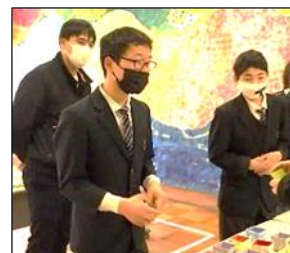
緊張していましたが バッチリできました。

5組では、くるみボタンで作ったマグネットと、牛乳パックにきれいな布を貼り付けて制作した小物入れを販売しました。2学期から制作に取りかかり、3学期から受付や接客の練習に取り組んできました。当日は、丁寧に接客する姿や臨機応変に対応する姿が見られました。振り返りでは、全員が「やりきった!」「頑張った!」と最高の笑顔で終えることができました。