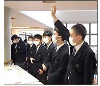
「アンケートの御協力をお願いします。」