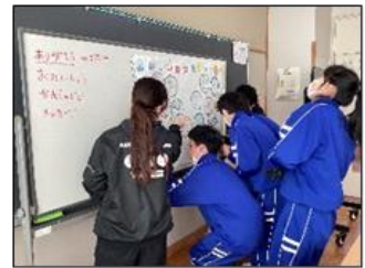
好きなメニューがいっぱいの献立にしよう！

献立作りに挑戦したことから、日頃の栄養教諭の先生の御苦勞を知ることができ、感謝の思いを込めてメッセージを書きました。「カレーライスが好きです。」や「心を込めて作ってください、ありがとうございます。」などの言葉をつづり、大きな紙面いっぱいにイラストなども添えて、感謝の気持ちを伝えることができました。