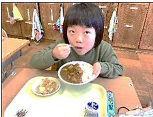
ごはん野菜、お汁を順番に食べるよ！

一日ごとにできていたか振り返り、達成できると花丸シールを表に貼っていきます。花丸が溜まって行くと「いっぱいになってきた！」と達成感を感じていました。これを機に三日の習慣として定着するよう引き続き指導・支援していきます。