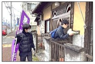
一軒ずつ丁寧にポスティングしました。