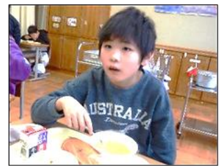
静かに黙々と食べています！