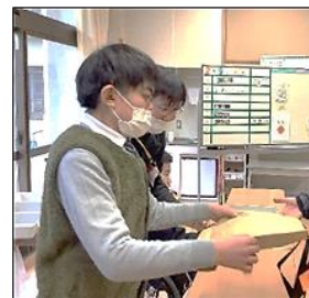
両手で丁寧に「どうぞ！」

3組では、「もったいない」をテーマに、普段は捨ててしまうもったいない物を、新たな商品に変えようということで、米袋を使ったかばん作りに挑戦しました。丈夫な米袋を切る作業に苦戦しながらも、作業の時間いっぱい集中して取り組むことができました。本番は、米袋で作ったオリジナルエプロンを身にまとい、元気よく接客することができました。