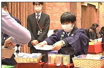
「お会計は〇〇円でございます!」

太鼓組の演奏も製品販売会も今年度の締めくくりということで、一年間取り組んできた成果を十分に発揮することができ、生徒たちの成長した姿が見られた販売会となりました。