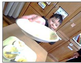
苦手なものも全部食べて頑張っているよ！