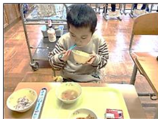
お皿を持って上手に食べています！