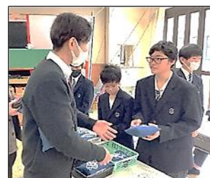
「染めから縫製まで、全て 僕たちがしました。」

6組では、1学期から中学部の畑で育てた藍を使用して、藍染めのテーブルセンターとミニクッション、額縁入りの藍染めを作りました。型染をする際の型紙も、一人一人が彫ってデザインしました。接客では、1学期の夏野菜販売会を振り返り「姿勢」や「声の大きさ」、「接客の言葉遣い（8大用語）」を意識して販売に取り組みました。振り返りでは、「自分たちが丹精込めて作った製品が売れた!」と満足した表情が見られました。