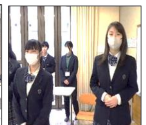
「またどうぞ、お越しくださいませ。」