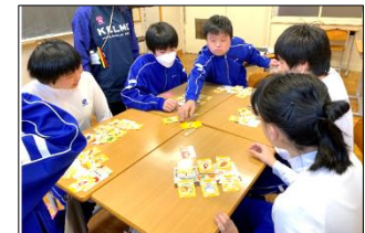
好きなメニューだけでなく、栄養も考えて献立を組みました！

給食月間の取組を通して、普段食べている給食について考え、栄養バランスについて興味を持ち、食に関する知識を高めることができました。