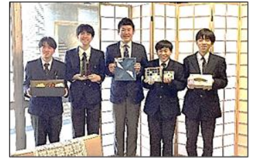
「素晴らしい製品の数々ですね。」とお褒めの言葉をいただきました。