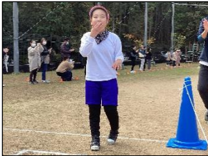
ゴールまでもう少し！

ゴール後は、「がんばったよー！」とそれぞれの目標に向かって全力を尽くせた様子や、疲れた中にもやり切った表情が見られ、達成感が伝わってきました。今後も体力向上を目標に指導・支援していきます。