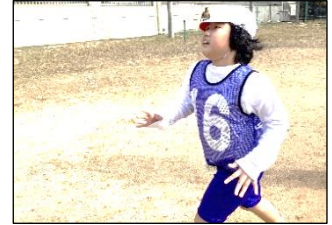
お家の人の声援も嬉しかったね。