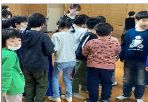
集合ゲーム！ここに集まれ～！

待ちに待ったプレゼント交換では、友達が作ったクリスマスカードを手にし、「かわいいね。」「すごく上手だね。」等、個性豊かなカードにうれしそうな表情がたくさん見られ、「次はいつサンタクロース来るのかな？」と次回を心待ちにしている児童たちでした。