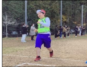
去年よりタイムが上がりました！