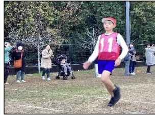
最後まで止まらずに走ったよ！