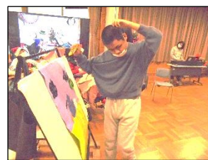
小学部の子たちに先輩らしいところを見せるぞ！！