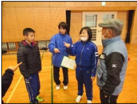
「ジャンケンで順番を決めよう。」

4・5組合同の生活単元学習では、「舞鶴市のスポーツについて知ろう！やってみよう！」をテーマに、舞鶴市出身のスポーツ選手や、市内で開催されるスポーツ大会などを調べました。また、市の振興課の方に来校いただき、スポーツに関する講話もいただきました。その中で紹介された、舞鶴市発祥のニュースポーツ「マイ(舞)パック」の道具をお借りして、後日みんなで練習しました。マイ(舞)パックは、ゲートボールスティックで木製のパックを打つ競技です。床の的(四角い枠)を狙い、枠内に入ったパックの位置によって得点が決まります。練習を重ねるごとに力加減のコツをつかんでいき、近くに寄せたり相手のパックをはじき出したりすることもできるようになりました。12月5日(火)には、振興課の方や推進委員の方にも来校いただき、一緒に競技をして汗を流しました。