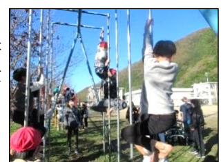
探検後、皆で遊んで楽しい♪

11月の交流及び共同学習は、池内小学校へ行かせていただきました。池内小学校の児童たちが案内役となり、一緒に学校探検をしました。図書室・音楽室・放送室・理科室・職員室など様々な教室を案内してもらい、最後はグラウンドへ出て、皆で走り回ったり、支援学校にはない「のぼり棒」等の遊具で一緒に遊んだりしました。今後も継続して同世代との交流及び共同学習の機会を大切にしていきます。