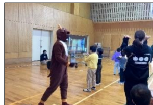
皆でダンスを踊ったよ♪