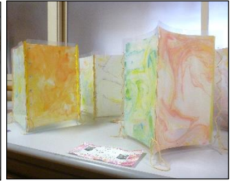
高5組 ランプシェード