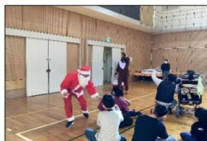
サンタクロースとトナカイ登場！