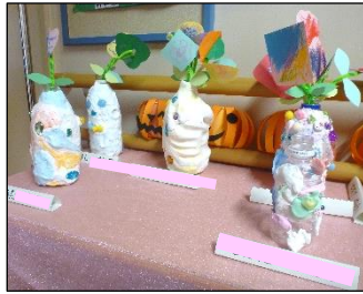
小12組 紙粘土の花瓶