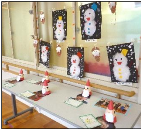
小3組 雪だるまとサンタの帽子

12月19日(火)～21日(木)の3日間、図工・美術等の学習で作った作品を教室前に展示しました。筆やタンポ・指などでダイナミックに色を塗ったり、手先を使って細かい作業をしたり、どの作品も1学期から取り組んできた一人一人の頑張りが詰まった個性があふれる作品ばかりでした。作品展示の様子の一部を御紹介します。