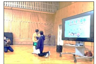
終わりの挨拶もばっちり！