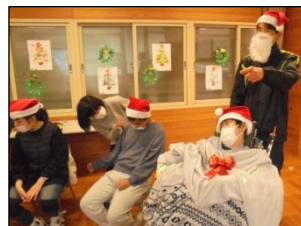
サンタの仮装もしました！