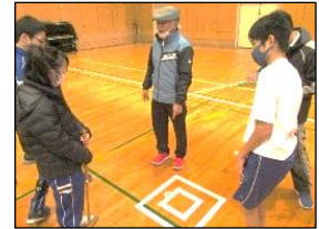
「ここを狙って止めるんだな。」