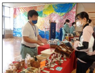
「どうぞ、手に取ってご覧ください！」