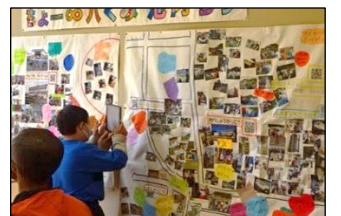
「ちょー∞池内マップ」