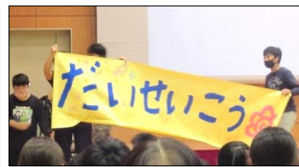
2日間の学校祭、無事終了しました！大成功！

学校祭「舞鶴わくわくフェス」の取組は、地域・社会のたくさんの方々に御理解・御協力いただき、無事に終了することができました。御来校いただきました保護者・地域の皆様、ありがとうございました。