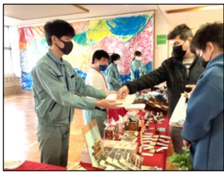
「おつりとレシートのお返し でございます！」