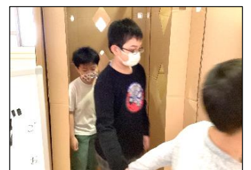
友達と一緒にゴールを目指しました。

学校祭初日、2階ワークスペースに突如現れた巨大な建造物！「これはなんだ？！」と子どもたちはビックリしていました。その建造物とは、NPO法人「まいる遊 BixS(アソビックス)」の方々を組み上げた「巨大迷路」だったのです。ダンボールでできた「巨大迷路」は大人が入っても先が見えない高さの本格的な迷路でした。子どもたちは、恐る恐る入り口から中をのぞきこみ、勇気を出して入って行きました。試行錯誤しながら、ゴールまでたどり着き「あ〜、楽しかった！」「もう一回行く！」と何度も繰り返し体験していました。