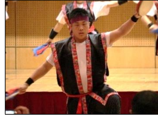
3年生は最後の学校祭！バッチリ決めました。