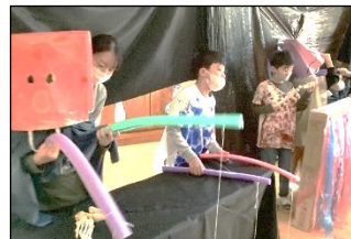
「ようこそ！ととまるやしきへ」