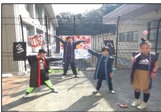
「魚っちパークへようこそ」

海をテーマにした手作り楽器や等身大の魚のオブジェを飾って、素敵な水族館がオープンしました。お客さんとノリノリで楽器を鳴らし、ソロ演奏もバッチリ！スイッチを押して光る泡を出す係、始まりの掛け声係、進行係など、それぞれの役割に一生懸命取り組むことができました。