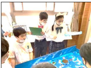
ボール入れや得点係を務めました。

「コロストーンチャレンジ」は、大地・海・森・宇宙の4つのテーマに分かれて、色を塗ったりオブジェを作ったりして作りました。当日は多くのお客さんに御来場いただき、大盛況！子どもも大人も白熱した真剣勝負が繰り広げられました。生徒たちは司会進行、スタンバイ確認や得点の計算、お客さんに楽しんでもらえるような言葉掛けなど、状況に応じて自分なりに伝えたり表現したりすることができました。大きな行事を終えた生徒たちの表情は、達成感でいっぱいでした。会場の舞鶴支援学校会議室は、日本…いや、世界で一番ホットな場所になっていました！！