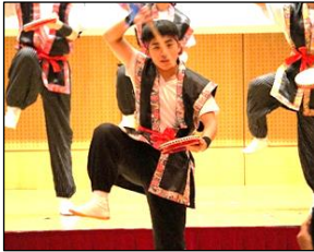
みんな息ピッタリ！手足の動きも揃っています！！

本番では練習の成果を発揮して踊り切ることができました。発表終了後、達成感を感じている生徒も、振りを間違えて悔しい思いをしている生徒も、互いに言葉を掛け合って自分たちの頑張りをたたえ、挑戦してよかったと思える取組になりました。