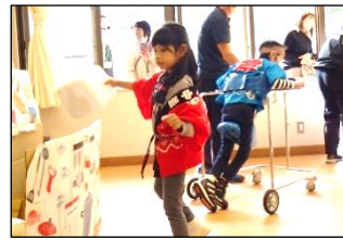
「きらり 11 組」