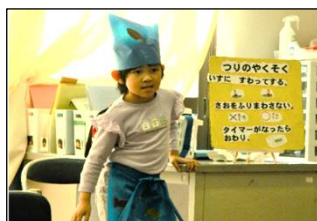
「ルンルンさかなつり」