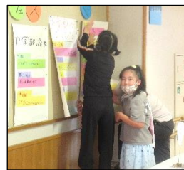
みんなで書いたプログラムを掲示しました。