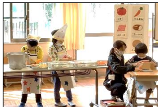
「いらっしゃい！2くみ」