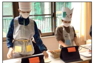
「きらーぐんカフェ」