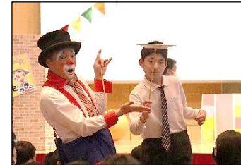
ピエロと一緒に皿回し！上手にできて、拍手をもらいました。

いたずら心やコメディ要素をふんだんに取り入れたサーカスで、3人のピエロが代わる代わる登場しては会場を盛り上げてくれました。「皿回しパフォーマンス」では、会場内の子どもたちも参加させてもらい、みんながピエロたちに向かって手を挙げて「こっちにきてー！」と猛アピールをしていました。終わった後、「もっと見たかったな。」とつぶやくなど、心に残る芸術鑑賞会となりました。