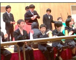
最後はカップスを頭に乘せて、ポーズを決めました！

このグループは、人を楽しませることを目標にして動画制作やダンス発表をしました。オープニング映像も自分たちで撮影しました。様々なふん装で役になりきり、楽器演奏や道具を使ったダンスなど、各々が工夫を凝らした映像が完成しました。映像の後は「♪大人ブルー」の曲に合わせて、カップスとダンスを披露しました。大きなカップスは迫力あるダイナミックな音と動き、小さなカップスは息の合ったリズムカルな動きなど真剣な姿を舞台で見せることができました。みんなで合わせて叫んだ「ハッ！」の掛け声が会場中に響き、大成功の発表となりました。