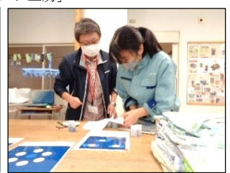
藍染タオルハンカチの丸い模様は フィルムケースで付けています！