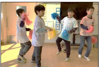
「ゴー！ゴー！シアター」

1学期から池内小学校や池内駐在所、舞鶴警察署等に出かけ、自分たちで場所のレポートや動画の撮影をしました。地図にまとめるときには写真やコメント、動画の二次元コードを貼り付けました。当日はタブレット端末の使い方やおすすめ動画を紹介して「ちょー∞(むげん)池内マップ」を説明することができました。