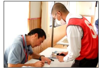
虫メガネを使って探しました。

学校祭の初日限定で、京都大学フィールド科学教育研究センター舞鶴水産実験所より講師の先生をお招きし、様々な種類の海の生き物について教えていただきました。また、高等部3・4・5組の生徒たちが体験者のアシスタント係を努めました。見つけた生き物の名前を先生に尋ねて体験者に伝えるなど、事前練習の成果を発揮してコーナーを盛り上げました。