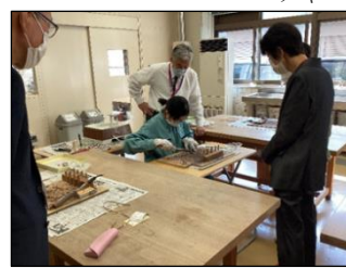
ガラスの製品作りを実演中！