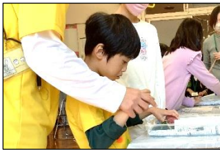
「あつまれ！1くみふえすていばる」

3組と4組は、合同でお化け屋敷をしました。準備や練習では、他学級の友達と協力しながら様々な小道具を作ったり、お化けや受付の練習をしたりしました。本番では、たくさんのお客さんを怖がらせることができ、最後の挨拶には達成感にあふれる良い表情で感謝を伝えることができました。