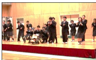
名付けて「ねこちゃんダンス」です。かわいいでしょ！？