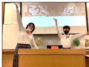
みんな楽しんでくれたかな？