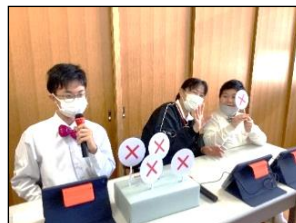
コンダクターとタイマーボーイも会場を盛り上げました。