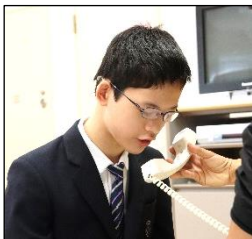
校内放送や司会進行は、ゆっくり大きな声で頑張りました。

学校祭当日は大勢の前で緊張しながらも司会や挨拶、校内放送での発表紹介などそれぞれの役割を果たすことができました。