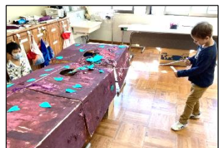
「劇団しちへ ようこそ！」