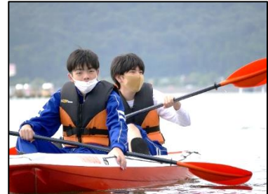
2人で協力して、上手に漕ぎました！