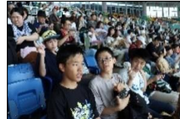
イルカショー、水がわかりそう！