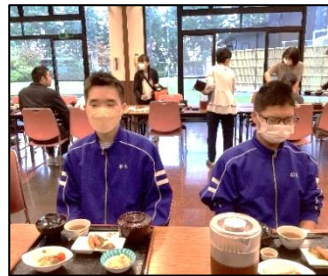
ホテルのご飯、おいしかった！