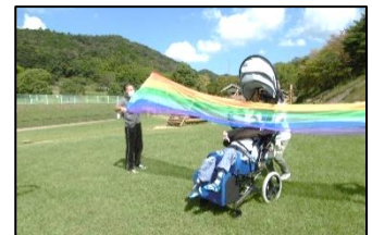
ロンドン橋が落ちて、大笑い！

普段体験することのできない場所へ行き、友達と一緒にたくさん交流したり活動したりする校外学習になりました。