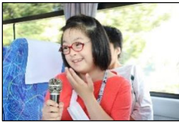
バス内も盛り上がりました！

2日目は、朝から起床予定時刻より早く目が覚め、待ちきれない様子で2日目を迎えました。アドベンチャーワールドでは、2班に分かれての班別行動。「ケニア号でいろいろな動物が見られて楽しかった。」「冷房が効いていて快適だったよ。」「イルカショーで大きなジャンプが凄かったね。」など、お互い情報交換をしながら喜びや楽しさ、驚きもみんなで共有していました。その後の三段壁洞窟では、臨場感あふれる大きな波を間近で感じるすることができました。