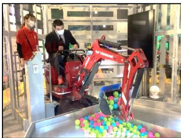
ショベルカー運転体験！本物の重機を操作！