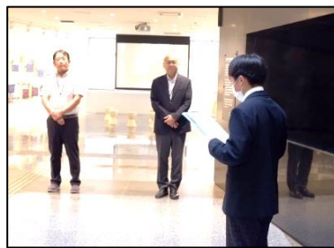
平和祈念館。 戦争のない世界になりますように！