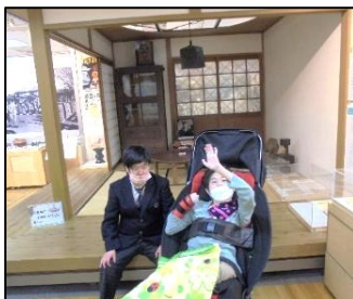
ちょっと休憩。はい、チーズ！

3日間様々な体験を通してたくさんの友達と関わりを深めたり、お互いの良さを知ったりすることができた最高の修学旅行となりました。