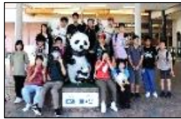
大きくてかわいいパンダたちにも会えました。