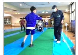
地域の方とたくさん話すことができました！