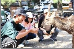
想像以上の鹿の数！ドキドキしながら餌(えさ)をやりまし

この修学旅行が初めて泊を伴う行事となる3年生18名は、緊張と期待で胸を膨らませ元気に出発しました。1日目の奈良公園では、鹿せんべいを手に積極的な鹿に囲まれ、笑顔や歓声、悲鳴など、ここでしか味わえない体験を満喫することができました。また、世界遺産の東大寺では、世界最大級の木造建築物や想像を絶する大きさの大仏様の迫力に思わず息をのみました。もちろん、大仏様の鼻の穴と同じ大きさで有名な柱くぐりにも挑戦しました。夜は、初めて友達と一緒に入る大浴場に興奮しました。数種類の湯舟や露天風呂、サウナなどを堪能し、温泉を満喫することができました。