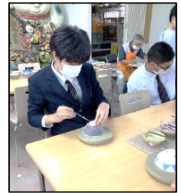
信楽で絵付け体験！ 出来上がりが楽しみ！