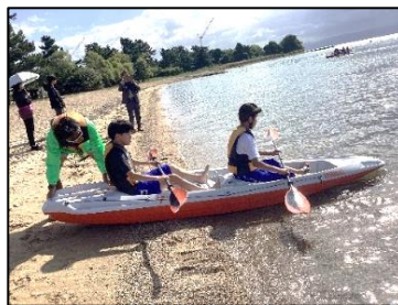
カヤック体験！琵琶湖へGO！