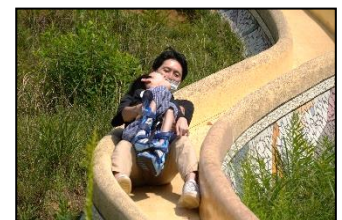
滑り台、風が気持ちいい～！