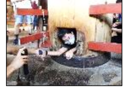
ちょっと狭いけど通れるかな？

2日目は、朝から起床予定時刻より早く目が覚め、待ちきれない様子で2日目を迎えました。アドベンチャーワールドでは、2班に分かれての班別行動。「ケニア号でいろいろな動物が見られて楽しかった。」「冷房が効いていて快適だったよ。」「イルカショーで大きなジャンプが凄かったね。」など、お互い情報交換をしながら喜びや楽しさ、驚きもみんなで共有していました。その後の三段壁洞窟では、臨場感あふれる大きな波を間近で感じるすることができました。