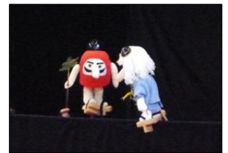
可愛らしく動く「だるまちゃん」と「てんぐちゃん」。絵本の中から飛び出てきたようでした。

今回は「だるまちゃんとてんぐちゃん」という絵本を題材にした人形劇を鑑賞しました。児童生徒たちはお話の世界に入り込み、笑ったり驚いたりして楽しく鑑賞することができました。鑑賞後は、「おもしろかったです。」「だるまちゃんが好きです。」などの感想を发表或し、学級で感謝状を作成したりしました。絵本や本を鑑賞するととてもよい機会となりました。