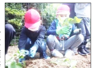
葉っぱは土の上に出して茎の部分だけを埋めました!

今後は秋の収穫に向けて、各学級で水やり・草引きを行いながら、苗の成長を観察したり、地域の方と交流したりと取り組んでいきます。