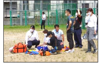
怪我で動けない生徒がいる状況を想定した救助訓練も行いました。

昨今、北陸や九州で地震が多く発生しています。舞鶴は海に面しており津波の心配がある土地です。また東日本大震災の教訓も生かしながら、「正常性バイアス(周りの人が逃げていないから、自分も逃げなくても大丈夫だと思う状態)」にならず、いつでも気持ちの非常スイッチを入れられるよう、学校として継続して災害対策に取り組んでいきます。