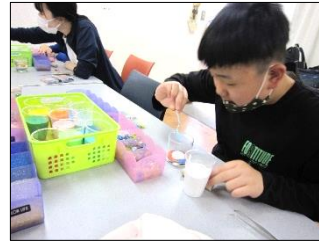
選んだ材料を入れて世界に一つだけのキャンドルを作りました♪