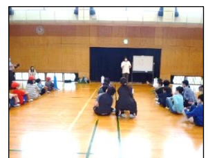
池内小学校の5年生と、本校の5年在籍学級の5・6・8・9・11組が交流を行いました。

5月初めに、それぞれの学校で作成した自己紹介動画を交換して視聴し、直接交流に向けてお互いに質問を考えてきました。5月30日(火)の第1回目の直接交流では、名前や好きな物などを書いたワークシートを手に持ち、再度一人ずつみんなの前で自己紹介をしました。「一番好きな勉強は何ですか?」といった質問をしたり、「支援学校はどんな授業がありますか?」などの質問に答えたりして交流を深めました。最後は、「一年間よろしくお祈りします!」という気持ちを込めて、みんなでハイタッチをしてお別れしました。今後は、本校からも池内小学校を訪れ、交流する予定です。