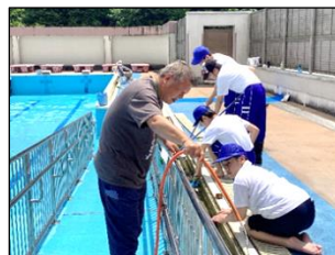
気温は30℃を超えて大変暑い中でしたが、半日かけて清掃しました。全員で汗を流しながら頑固な汚れと格闘しました。