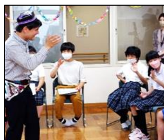
家紋入りの帽子など、民族衣装も紹介していただきました。

交流当日は、緊張しながらも、ハイタッチやハグをしながら練習したウズベク語での挨拶をして交流をすることができました。異文化理解の学習を通して、積極的にコミュニケーションをとる姿勢や自分と異なる考えや価値観を知り、受け入れることを学びました。