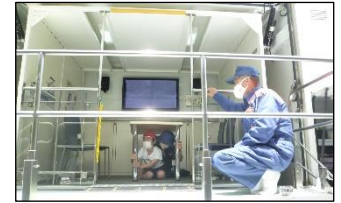
起震車は想像よりも揺れが大きくて少し怖かったです。