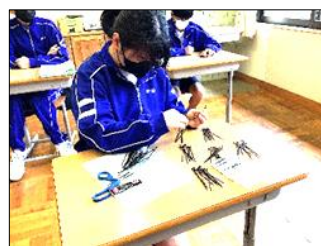
「10個のまとめりを作ると、集計がしやすい」ことにも気が付き、より正確に速く数えられるようになりました。

学習を進めていく中で「2個や、5個ずつ数えると速い」「形がそろっている物は同じ高さに積む」といったことに自分たちで気付きました。気付いたことを生徒同士で共有して自分の数え方にどんどん取り入れ、正確に、短時間で数えることができるようになってきています。今後、作業学習や日常生活の場面にも生かせるよう継続して指導していきます。