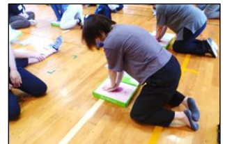
音が鳴る練習キットを使って胸骨圧迫を練習しました。

児童生徒に緊急を要する事態が起こっても、教職員間で連携し適切な対応ができるよう、日頃から指導者の動きや体制を十分に確認して安心・安全な学校生活を送れるように努めます。