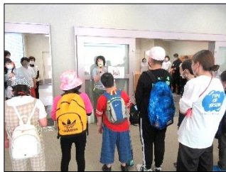
出発式では、楽しみと期待でいっぱいの表情でした。

バスの運転手さんや施設・宿泊地の従業員の方々に「挨拶する」こと、「みんなで一緒に行動する」ことなどの約束をしっかり守り、思い出に残る修学旅行となりました。