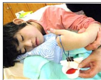
染液がきれいに染み込んでいくのを確認しながら作業しています。

作品は、七夕飾りに使うだけではなく、グレイスヴィル舞鶴さんにも使っていただけるよう、校外学習で届けに行く計画も立てています。