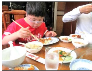
普段の食事とはまた違う味付けも美味しく完食しました！