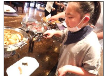
事前学習での学びを生かし、適量を取って食べられました。