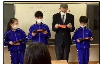
タブレット端末を活用して、それぞれ考えたメニューを発表しました。

考えた献立を基に、各学級でメニュー名も考えました。「栄養たくさんカレー野菜炒め」「野菜たっぷりラーメン」「黄金のコケから」等、聞いた人が、「どんな給食なんだろう？」と楽しみに思ってもらえるような名前を付けることができました。生徒たちは、どの献立が採用されるかドキドキしながら待ちます。3月の給食が待ち遠しい様子です。