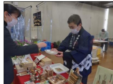
両手を添えて、丁寧な接客をしています。