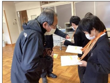
相手に伝わりやすい声の大きさを意識して丁寧な言葉遣いで話しました。