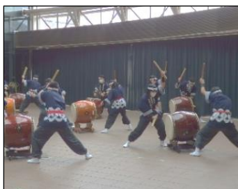
太鼓組の迫力のある演奏で販売会がスタートしました。

販売会場には作業学習で製作した「農園芸」「ガラス工芸」「工芸」「陶芸」「木工」の製品がずらりと並び、生徒たちの元気な「いらっしゃいませ！」の声に活気と笑顔が溢れました。今回の販売会では、例年の販売方法に加えてレジ袋の確認や感染予防のシールド使用など、新しい生活様式に対応した接客も加わり、事前学習から練習を重ねてきました。お客様からは、「ありがとう。」「これ、素敵だわ。」など笑顔と喜びの言葉をたくさんいただき、達成感の得られる販売会になりました。会場まで足を運んでいただきました保護者の皆様、地域の皆様、生徒たちへあたたかい御声援をいただき本当にありがとうございます。また、この日を迎えるにあたり、マナイ商店街の皆様には御協力いただきありがとうございました。