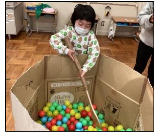
たくさんの具材が入った鍋を混ぜるのはとっても重い！

給食に携わる方々への感謝の気持ちは、学級ごとにありがとうカードを作成してお渡ししました。今後も様々な学習活動を通して、食事の大切さや感謝の心など、食に関する理解を深めていきます。