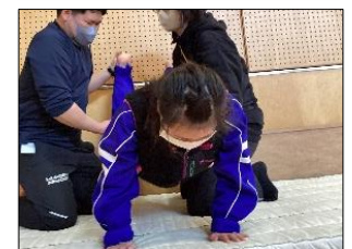
手をつく位置や体の状態を意識しながら練習に励んでいます。