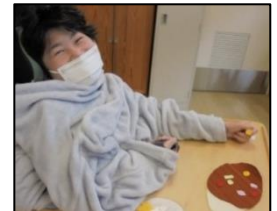
給食の美味しいカレーを思い浮かべてニコリ笑顔♪

1組では、「給食について知ろう！」と題して、代表的メニューの「カレーライス」が厨房で出来上がるまでの写真や動画などを見ました。どのような野菜や肉が使われているのか、そして、大きなヘラと鍋で具材を混ぜて作ってくださる調理員さんの仕事の様子を詳しく知りました。その後、野菜や肉に見立てたフェルト片を貼って、カレーヤシチューの作品作りをしたり、感謝の気持ちを込めて調理員さんへの感謝状を作って贈ったりしました。