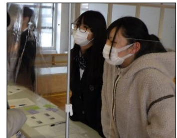
相手の顔を見て、接客することができました。