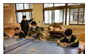
みんなで協力してボールをつないでいます。