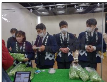
五大行動と八大用語を意識して、接客をしています。