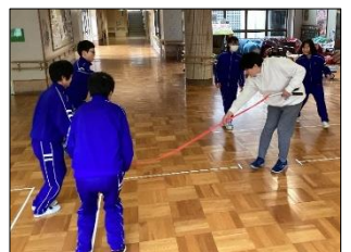
「プロペラ跳び」は、指導者が床に沿ってプロペラのように縄を回します。縄の回ってくる速さをよく見て、タイミングよくジャンプ!!

大縄跳びでは、「プロペラ跳び」と「♪郵便屋さん」の縄跳び歌に挑戦しました。個人練習では、指導者と一緒に跳んで「タイミングをつかむこと」を目標にしたり、駆け足跳びや片足跳びなどの「様々な技にチャレンジすること」を目標にしたりするなど、実態に応じて練習しています。難しい跳び方に苦戦する姿も見られますが、繰り返し根気強く取り組み、試行錯誤する姿が見られるようになりました。「前より跳べるようになった！」と喜ぶ姿もあり、少しずつ力を付けています。