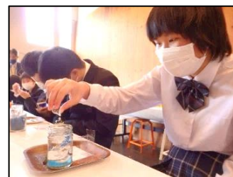
水中に漂うクラゲをイメージした、ハーバリウムを作りました。

2日間、絶好の秋晴れに恵まれ、様々な体験を通して生徒同士で関わりを深めたり、お互いの良さを知ったりすることができ、笑顔いっぱい、思い出いっぱいの修学旅行となりました。