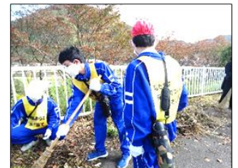
竹ぼうきを使い、友達と協力し合って草集めができました。

地域の方が事前に刈ってくださった歩道(高速道路出入口付近)の草の袋詰めや、学校周りの清掃作業を中心に、みんなで協力しながら時間いっぱい行いました。集めたごみは、空き缶・ビニール・プラスチックなど、分別作業もしました。どの生徒も意欲的に取り組むことができ、「きれいになった!」「気持ち良いね!」などと達成感のある感想が多く聞かれました。また、作業の途中には地域の方々との会話をしたり、上手く作業するコツなどを教えていただいたりするなど、地域の方々と交流することもできました。終了後に手洗いと消毒を徹底して活動を終了しました。