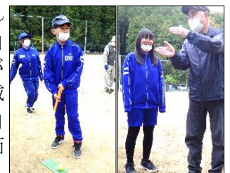
スポーツを通して、友達や地域の方とたくさん交流することができました。

11月4日(金)、池内地域の方々とグラウンドゴルフに取り組みました。生徒たちと地域の方と一緒にチームを組み、7つのホールを回りました。10月以降取り組んできた練習の成果を発揮することができ、よいプレーがたくさん生まれました。友達同士では、一つ一つのプレーに対し「ナイスショット!」「惜しい!」などと応援し合い、ゴールインまでチーム全員で根気強くプレーを続けることができました。また地域の方々からは、クラブの持ち方やボールを打つ際の力加減について丁寧に教えていただき、アドバイスを実践することで「上手に打てた!」と充実感に溢れる姿が見られました。友達や地域の方と会話や笑顔を交わす場面がたくさん見られ、様々な人と交流を深めることができるよい機会となりました。事後学習では、タブレット端末のアプリケーションを活用して、当日の活動についてまとめたプレゼンシートを作成し、3年生に向けた報告会で披露しました。お気に入りの写真を選んだり一言コメントを考えたりすることで、自分のプレーの様子や友達や地域の方々と頑張ったことを振り返りながら紹介することができました。