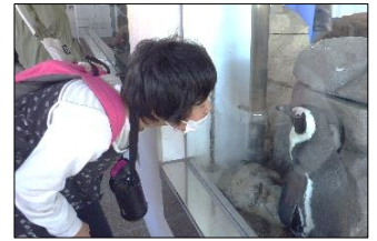
ガラス越しにこんなに近くでペンギンを見ました！