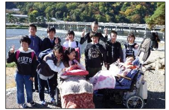
快晴の嵐山で、散策や食事、買い物を楽しみました。

2日間とも天候に恵まれ、11月にもかかわらず汗ばむほどの陽気の中、集団の中で自分の役割を果たし、友達と一緒に活動する中で、協力し合う姿があり友達同士のつながりが深まり、思い出に残る修学旅行となりました。