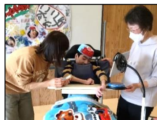
笑顔でスイッチを押して、スライドを紹介しました。

昨年度の3学期から入浴剤作りに取り組み、11月4日に行永分校で「ボーイズショップ」を開店しました。当日はそれぞれ4名のお客さんの対応をしました。相手の顔を見て、それぞれの表現方法でお客さんとやり取りをすることをねらいに、タブレット端末の「keynote」というアプリを使って入浴剤や製作中の様子の写真を見せるなどして紹介しました。生徒たちは少し緊張しながらも笑顔を見せたり、相手にしっかりと視線を向けて挨拶をしたりして接客しました。プレゼントのしおりを相手が受け取ってくれたのが分かったと、指を開いて渡すことができました。自分たちが作ったものを買ってもらい、また喜んでもらえる嬉しさを感じることができました。また、分校の友達や指導者に入浴剤の製作中の動画映像を観てもらおうなどして、日ごろの頑張っている様子を発信することもできました。