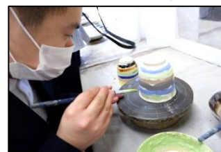
自分たちで絵付けした器の焼き上がりが楽しみです！