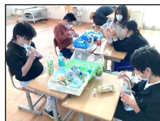
ペットボトルのラベルを丁寧にはがしています。

3組は生活単元学習で、4・5組は職業で資源回収のしくみ、分別の仕方、アルミ缶のプルタブやペットボトルのキャップを集めると何に変わるか等を学習しました。そして、ペットボトルのラベルをはがしたり、アルミ缶やペットボトルをつぶしたり、キャップやプルタブを数えたりしました。生徒たちは、黙々と作業しながら、自分たちの仕事が社会貢献につながることを意識し充実感を得て取り組んでいます。