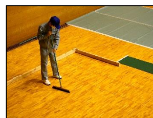
本番は緊張する中でしたが、練習してきたことを思い出しながら、丁寧に作業できました。

検定は、11月16日(水)京都府立伏見港公園体育館で行われました。本校からは、生活自立コース・職業自立コースの生徒が「自在ほうき」「乾式モップ」また、これらの種目を合わせた「複合」の部の中から1種目の検定に挑戦しました。生徒たちは、広い会場や検定員を前にして緊張していましたが、1学期から「職業」の授業や普段の清掃活動の中で練習してきた成果を発揮することができ、技能に応じて認定証が授与されました。